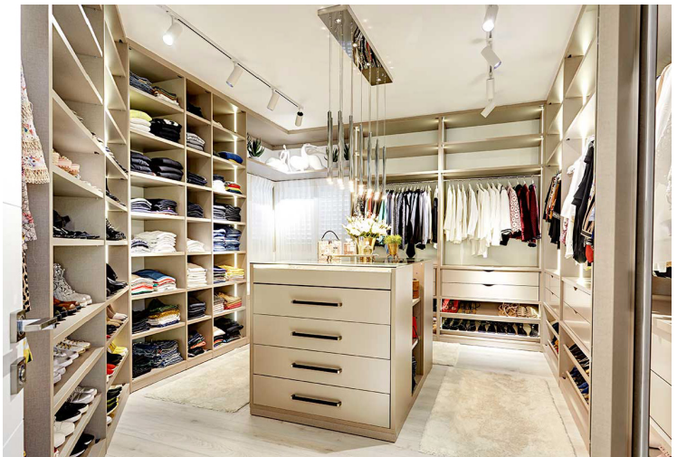
חדר ארונות בצורת ח