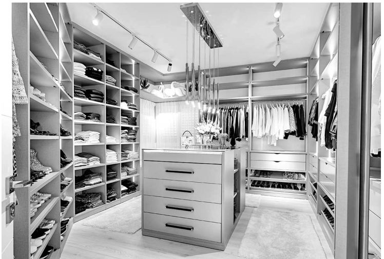
חדר ארונות בצורת ח